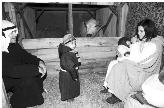
Due anni fa l'ultima edizione del Presepe Vivente

I bimbi della Scuola d'infanzia saranno i protagonisti della recita "Il Presepe lo facciamo noi". Lo spettacolo è in programma per i genitori e i parenti la sera di sabato 19 dicembre presso la palestra delle scuole. Ci sarà un'anteprima nei giorni precedenti per gli ospiti della Casa di riposo duran-