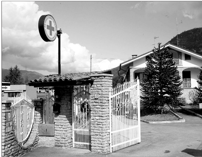
La sede della Croce Verde di Sanfront