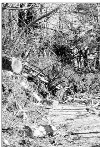
I proprietari sono tenuti a tagliare rami ed arbusti nelle zone a ridosso delle strade

Quanto sopra per eliminare ogni pericolo per la pubblica incolumità. Il pro-