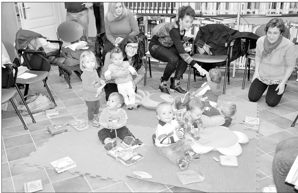
La recente festa per la consegna di un libro ai bimbi nati nel corso dell'ultimo anno

Ecco alcune anticipazioni sui testi che troverete