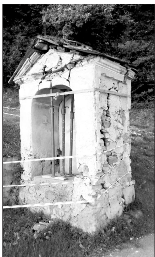
Il pilone votivo versava in condizioni assai precarie

Purtroppo i piloni votivi, che un tempo costituivano un punto di sosta per gli agricoltori per la recita di alcune preghiere di conforto e di grazia, ora stanno a poco a poco scomparendo