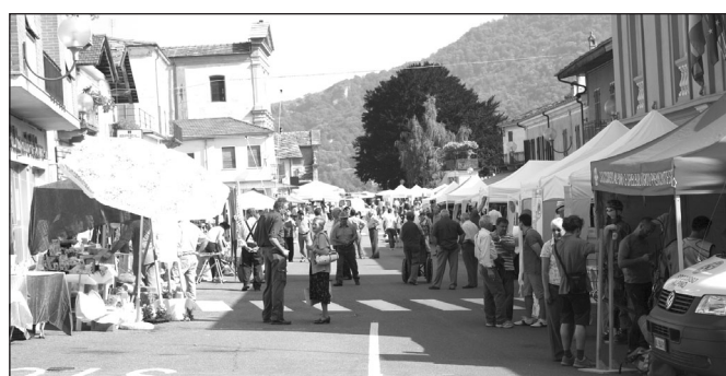
Tanta gente alla 3° edizione della Fiera della Montagna

Dopo i discorsi ufficiali e la firma del gemellaggio, c'è stato spazio anche per la consegna di una pregevole scultura, opera dell'artista sanfrontese Germana Eucalipto, alla Comunità di Pastrengo