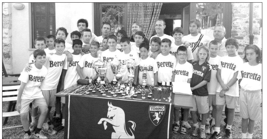
Le decine di ragazzi di Sanfront e paesi vicini che hanno partecipato al Camp del Toro

Ho chiesto a loro consigli su come e dove migliorare, ricevendo da Mezzano stesso il via libera per l'ospitalità di squadre professionistiche, essendo il campo di recente omologazione per l'Eccellen-