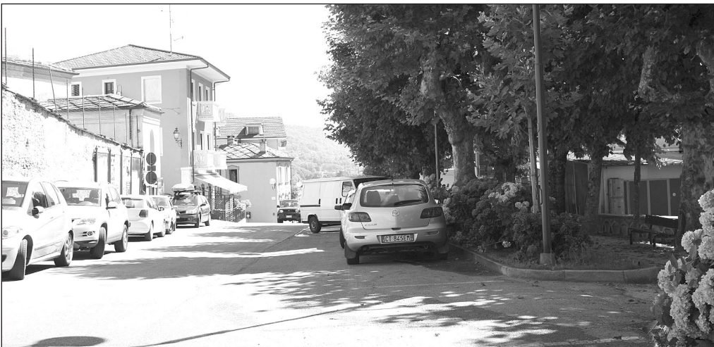
La stessa inquadratura su Corso Vittorio Veneto, oggi

completare l'opera intrapresa sostituendo, prossimamente, anche i pali e corpi illuminanti residui questa volta,