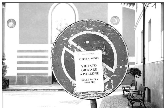
Il Comune ha disposto il divieto di giocare a pallone in alcune piazze, tra le quali P.za Ferrero e P.za De Caroli

Ci sono stati già alcuni incontri tra Comune e Parrocchia ed una soluzione sembra ormai essere stata individuata. Per consentire ai bambini di giocare a pallone senza arrecare disturbo alla quiete pubblica o causare danni, ma soprattutto in condizioni di massima sicurezza, verrà rimesso a disposizione dei ragazzi il cortile dell'Oratorio.