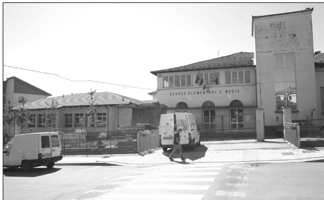
Quasi pronto il ristrutturato nuovo edificio scolastico a sinistra della struttura principale