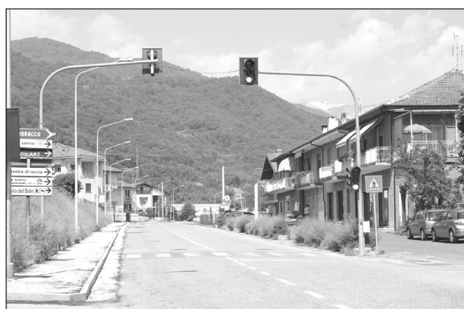
Completamente rifatti i marciapiedi in Via Valle Po, ora finalmente percorribili

Ma veniamo allo stato attuale. Prescindendo dalla nuova mensa per la scuola materna e dal nuovo edificio scolastico in Corso Marconi i cui lavori stanno volgendo al termine garantendo, molto probabilmente, la funzionalità dei due interventi già per l'inizio dell'anno scolastico 2012/2013, dai nuovi loculi in costruzione nel cimitero di Sanfront e Rocchetta già utilizzabili, sebbene tale eventualità non sia mai auspicabile ed in corso di concessione, nel giro di un paio di mesi e dall'ultimazione dei nuovi marciapiedi in Via Valle Po (con un'aggiunta decisa nell'ultimo tratto di Via Trieste per migliorare la fruibilità del manufatto), vi sono altre opere che attendono di essere attuate, alcune già segnalate, quali, ad esempio, la sistemazione di due versanti presso la Borgata Barilot e