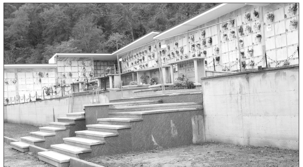
Dopo la scala, nel cimitero del capoluogo si costruiranno nuovi loculi