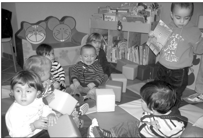
Piccoli lettori crescono...in Biblioteca

La sera di venerdì 22 ottobre la Biblioteca è stata visitata dai piccoli della leva 2009; insieme alle loro famiglie hanno accolto l'invito del progetto regionale "Nati per leggere", che dona un libro a tutti i nati dell'anno precedente. Per la nostra biblioteca è la terza edizione del progetto, il cui scopo è promuovere la lettura ad alta voce ai bambini di età compresa tra i 6 mesi e i 6 anni, per offrire loro adeguate occasioni di sviluppo affettivo e cognitivo.