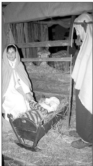
Venerdì 24 dicembre

Lungo il percorso saranno distribuite bevande calde (vin brulè), cioccolata, paste di meliga e caldaroste tra balli locali e canti