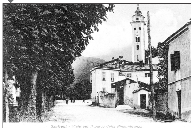
Sanfront - Viale per il parco della Rimembranza