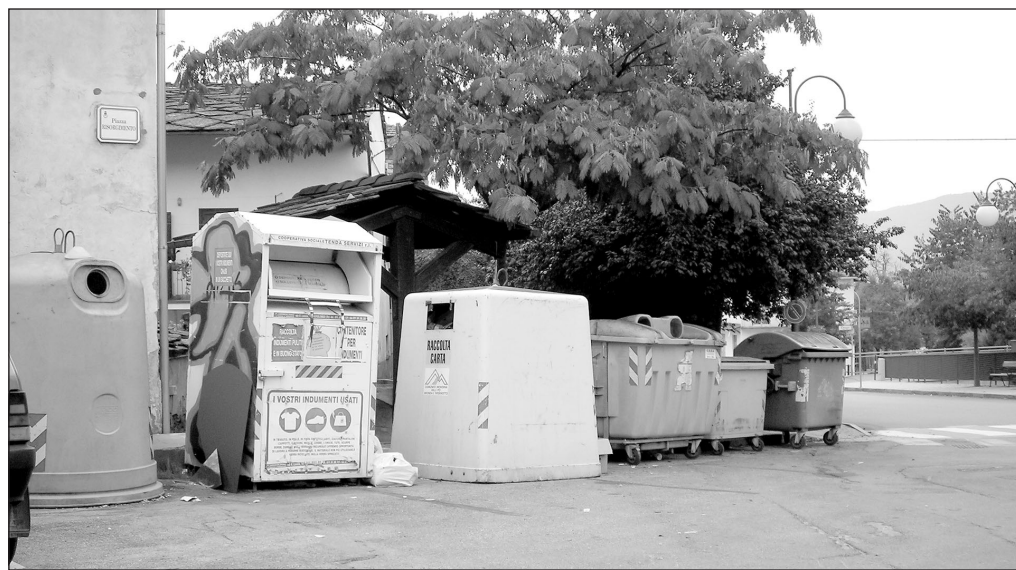
I vecchi contenitori per la raccolta saranno sostituiti da nuove isole ecologiche