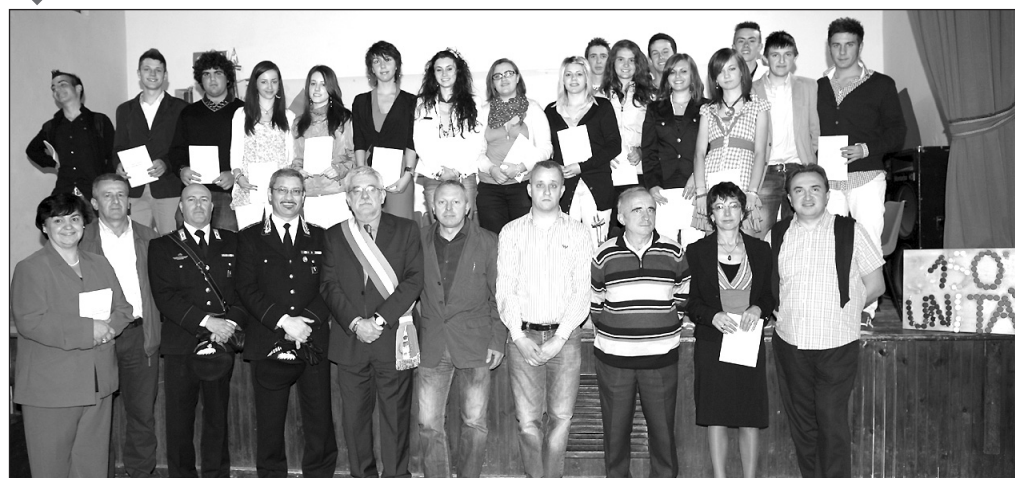
Anche quest'anno si è tenuta la cerimonia di consegna da parte dell'amministrazione comunale della Costituzione Italiana ai neo maggiorenti di Sanfront.