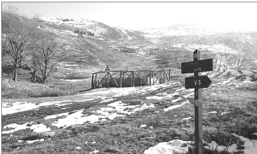
E' stata sistemata la strada che porta alla località Pasturel

I lavori stradali, ritenuti prioritari dall'attuale amministrazione, interesseranno nei prossimi mesi molte parti del territorio comunale. E' stato infatti approvato il progetto esecutivo redatto dal geom. Dante Martino riferito alla sistemazione di un tratto di Via Madonna dell'Oriente (70.000 euro) ed è in corso la predisposizione (ottenuta l'autorizzazione idrogeologica) della progettazione esecutiva per la realizzazione di una pista forestale in frazione Comba Gambasca il cui onere sarà pari a 80.000 euro. Sono invece "a Bilancio" e l'Ufficio Tecnico Comunale sta approntando la rispettiva progettazione ulteriori sistemazioni varie che interesseranno altre strade da Via Braide a Via Serro a Via Robella sino a Via della Fraita con un occhio di riguardo verso Piazza don Sossò , sempre in frazione Robella, davanti alla Parrocchia della Madonna della Neve dove è prevista la predisposizione di una nuo-