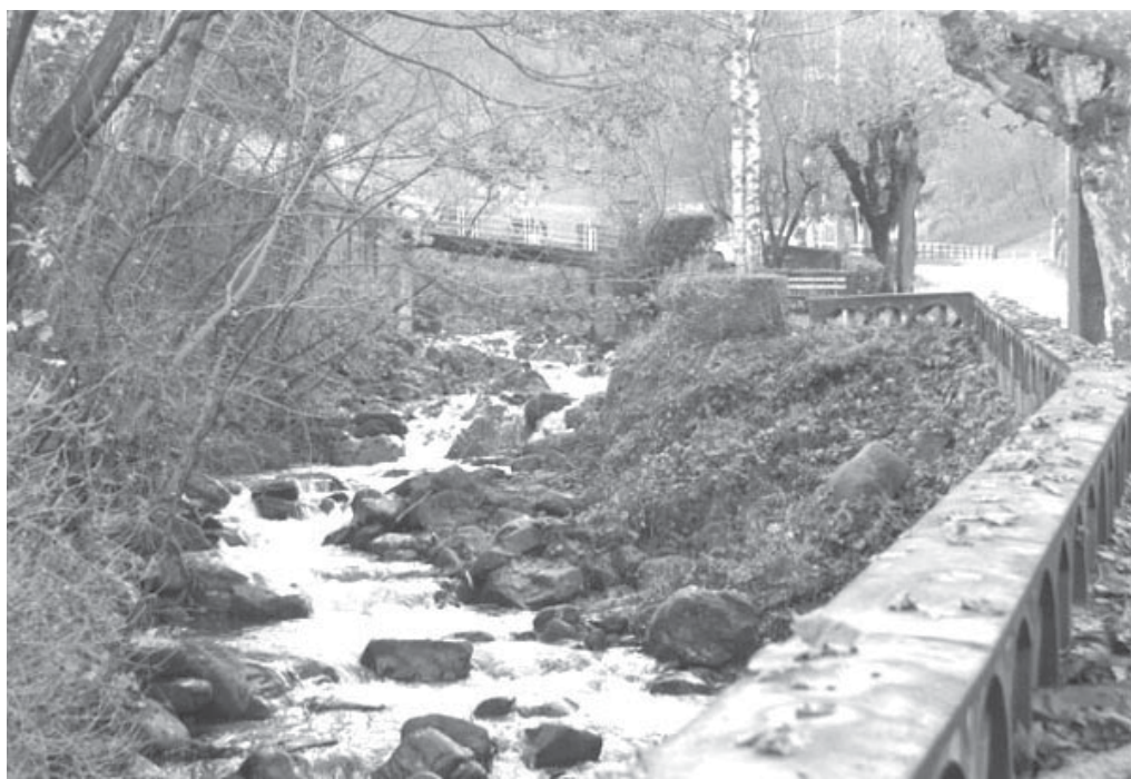
I lavori interessarono la parte a monte del rio Albetta, nel borgo vecchio

A Sanfront si ritorna a parlare del Rio Albetta. Dopo la conclusione dei lavori, avvenuta il 23 dicembre 2005, relativi alla sistemazione dell'alveo nella zona di centro abitato (per uno sviluppo complessivo pari a 950 metri partendo dal ponticello in Via Comba Albetta sino alla strada provinciale ed oltre, verso Via Braide) come previsti dalla perizia esecutiva redatta dall'ing. Valter Ripamonti di Pinerolo riguardante il più "costoso" intervento particolare nella storia dell'amministrazione pubblica sanfrontese, ammontante a 1.100.000,00 euro interamente finanziati dalla Regione Piemonte nell'ambito dei fondi CIPE riferiti ad un accordo di programma quadro sulla difesa del suolo del 16/12/2002, ecco che, a seguito di un'apposita istanza inoltrata alla Regione Piemonte nel mese di settembre del 2006, un altro progetto "di completamento" ha ottenuto il relativo finanziamento a seguito dell'inserimento del medesimo, da parte del Ministero dell'Ambiente e la Tutela del Territorio, nel "secondo Piano Strategico Nazionale per la Mitigazione del Rischio Idro-