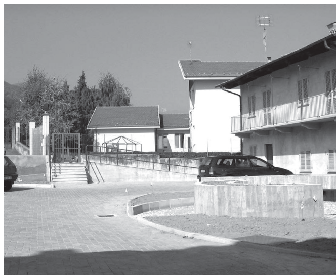
L'accesso alla scuola materna dal cortile dell'ex asilo

E' in dirittura di partenza anche il campo da calcetto illuminato presso gli impianti sportivi comunali in Via Montebracco (V lotto dei lavori principali) dove la spesa complessiva pari a