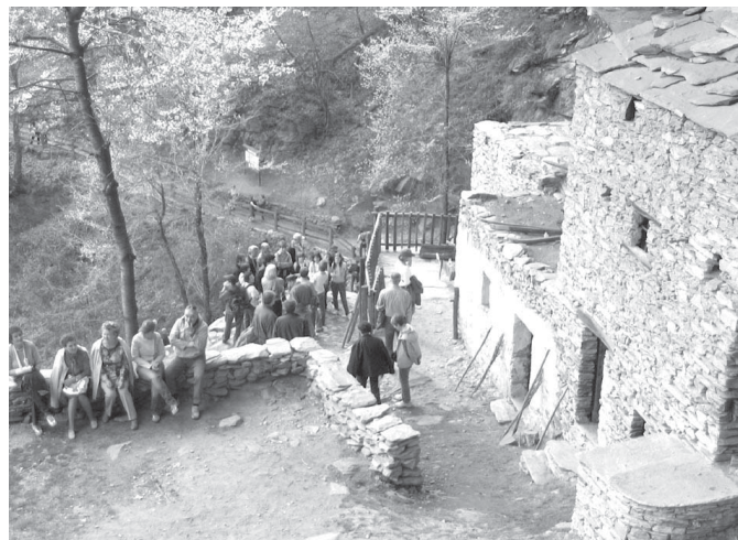
La borgata museo è gestita dall'associazione Marcovaldo

Già da quattro anni la borgata-museo Balma Boves è aperta ai visitatori dalla primavera fino all'autunno. Fin dal primo anno l'afflusso dei visitatori è risultato soddisfacente e da allora si registra un trend positivo di crescita delle presenze.