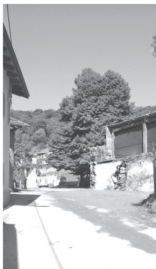
L'ingresso alla piazza della frazione Rocchetta

A completamento delle opere saranno infine forniti