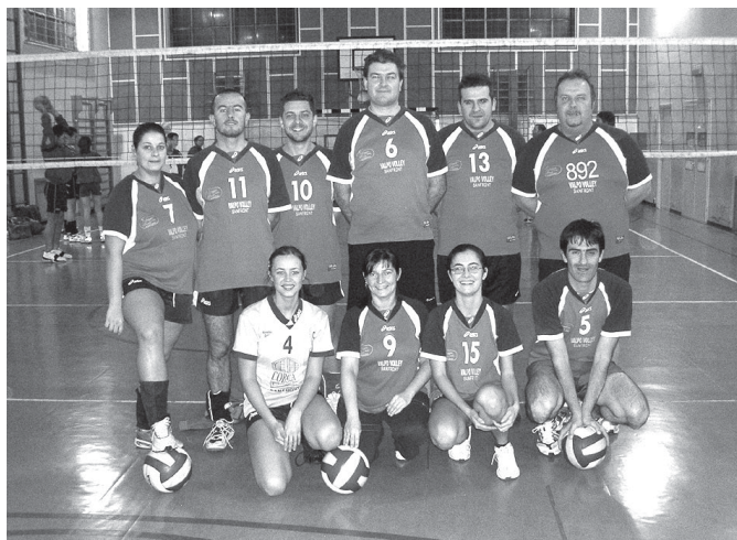
La squadra della ValPo Volley, che ha disputato lo CSI