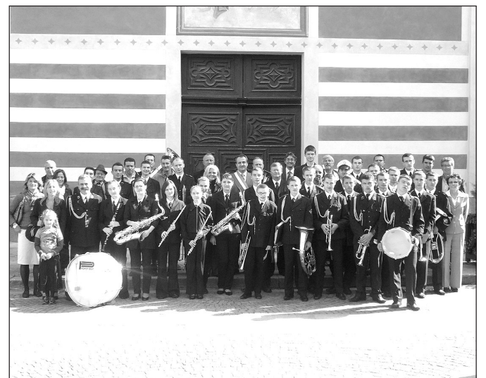
L'"Orkiestra Olobok" ha animato la Messa a Sanfront

Dopo la visita di una delegazione sanfrontese composta da 23 persone, in Polonia il 29, 30 e 31 agosto scorsi organizzata per rinsaldare l'amicizia con il Comune di Sieroszewice ed il proprio sindaco Czesław Berkowski (già conosciuto a Sanfront per aver partecipato alle ultime edizioni della Sagra delle Botteghe con alcuni suoi collaboratori) il 27 e 28 settembre scorsi c'è stato un nuovo "scambio di cortesia" con l'"orkiestra Olobok", famosa per essersi esibita anche al cospetto di Papa Giovanni Paolo II, che si è esibita a Sanfront.