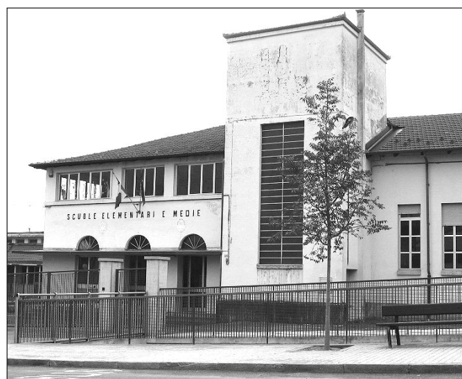
331 gli alunni iscritti nell'Istituto scolastico di Sanfront

L'altro elemento importante è il sensibile aumento degli alunni stranieri rispet-