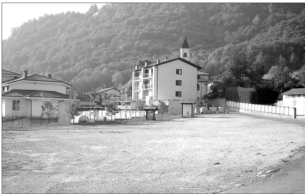
L'area sarà suddivisa in tre spazi con area ecologica, area verde e parcheggio

La suddivisione dei tre spazi sarà garantito mediante la realizzazione di un muretto in calcestruzzo rivestito in pietra a spacco naturale sormontato da una palizzata lignea formata da elementi verticali e/o orizzontali. Nell'area ecologica (la cui pavimentazione sarà realizzata mediante masselli autobloccanti) saranno sistemati gli appositi contenitori per i rifiuti solidi urbani e la raccolta differenziata, nell'area verde, invece, troveranno posto tavoli, panchine, cestini, giochi per bambini, il tutto installato su di un apposito manto erboso che si andrà a realizzare previo riporto di terreno vegetale sul quale sarà seminato un apposito miscuglio di sementi. Nell'area a parcheggio è prevista l'installazione ulteriore di alcune panchine e cestini oltre alla stesura di materiale fine ghiaioso al fine di migliorare il fondo stradale garantendone l'inserimento ambientale (per questo scopo si è cercato di evitare il "so-