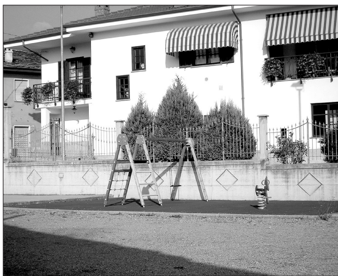
La nuova area giochi bimbi in frazione Serro

Ancora entro fine anno è altresì probabile l'appalto dell'area a parcheggio a servizio della palestra di roccia in frazione Mombracco (40.000 euro) su progetto del geom. Alfredo Beitone di Paesana e dei lavori di sistemazione dell'area pubblica in frazione Robella (la nuova Piazza) per la quale è stata approvato il progetto esecutivo redatto dal geom. Valerio Ferrero ammontante a 70.000 euro finanziabili mediante un mutuo da contrarre con la Cassa Depositi e Prestiti. Sono state invece espletate le procedure d'appalto riferite al completamento degli impianti sportivi, V lotto - costruzione campo da calcetto, addivenendo all'affidamento delle relative opere alla ditta "Costruzione Impianti Sportivi Parola geom. Mario" di Borgo San Dalmazzo la quale ha praticato un ribasso del 19,12% sull'importo posto