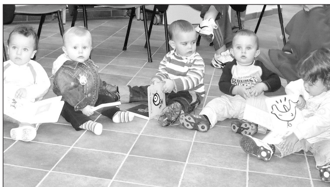
Alcuni dei bimbi presenti alla serata in Biblioteca

Il 26 settembre si è svolta in Biblioteca una serata speciale: all'appuntamento erano invitati i piccolissimi lettori sanfrontesi nati nel 2007! I bambini - accompagnati ovviamente dai genitori - hanno ritirato il libro omaggio a loro riservato nell'ambito del progetto "Nati per Leggere Piemonte". Ai genitori sono stati forniti materiali e chiarimenti sul progetto, che è senza fini di lucro e non ha alcun intento promozionale o commerciale. È stata un'occasione per far conoscere ai più piccoli e alle loro famiglie la nostra biblioteca ed il suo patrimonio librario, che si compone anche di molti testi di prelettura, con simpatiche ed accattivanti illustrazioni. Le famiglie che non hanno partecipato potranno ritirare il libro in Biblioteca durante il normale orario di apertura.