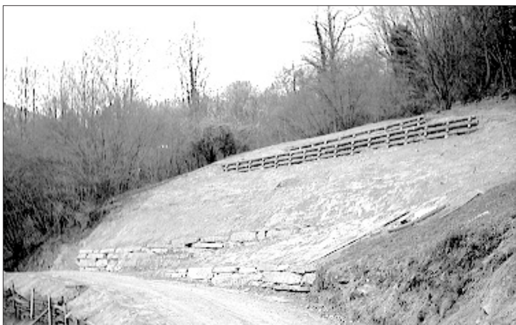
Le opere di ingegneria naturalistica impiegate nella sistemazione della frana in località Pasientin dopo le alluvioni degli ultimi mesi

Il mese di maggio vedrà altresì l'inizio dei lavori relativi al potenziamento della rete di illuminazione pubblica per la quale sono previsti due lotti d'intervento, entrambi realizzabili dalla Società SO.L.E. del gruppo Enel. Una prima "trance" riguarderà 25 punti luce