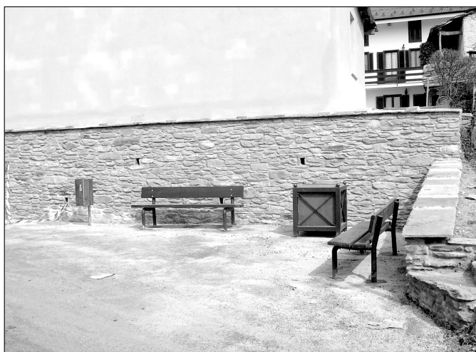
La nuova area attrezzata all'ingresso di Rocchetta

tura interna del fabbricato uso scuole elementari e medie.