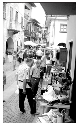
Un'immagine della Sagra delle Botteghe del 2008

Pochi lo sapranno come si diceva prima, anche per un altro motivo: per ora non sono ancora arrivate le manifestazioni più importanti per il nostro paese, sarà quindi con dispiacere di molti, non vedere organizzata la Sagra delle Botteghe, le serate di ballo e le altre manifestazioni collegate all'Assunta, il Presepe Vivente, solo per citare le più importanti. Non si vuole qui spiegare i motivi per cui si è arrivati a questo punto, piuttosto si vuole ancora una volta dare atto all'ultimo direttivo dell'associazione del profondo attaccamento che ha dimostrato nei confronti della Pro Loco e del suo senso di responsabilità "congelando" la partita iva per evitare spese e dare modo, si spera, al futuro direttivo di riprendere le attività senza dover affrontare ad esempio spese notevoli per rimettere in piedi l'associazione.