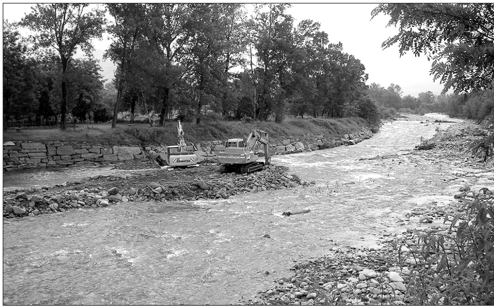
Ripetuti eventi atmosferici hanno creato danni soprattutto nel fiume Po e torrenti

12.000 euro per la sistemazione stradale in Via San Chiaffredo di Comba Gamba (muro a blocchi e opere complementari); 12.000 euro per la sistemazione stradale di Via Com-