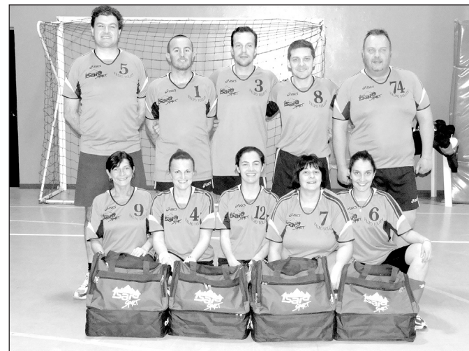
La squadra della Valpo Volley