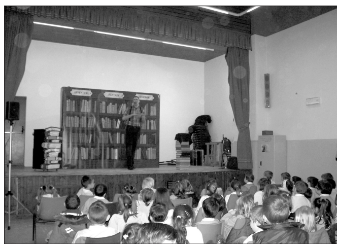
Un momento dello spettacolo per i bimbi dell'asilo

Sempre al fine di promuovere la lettura fin dalla più