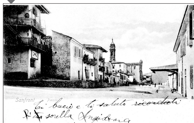
Com'era l'attuale piazza Statuto nel lontano 1904