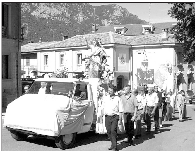
La solenne processione del giorno dell'Assunta

Ore 14,30 gara a petanque a bocce vuote presso "Bar Due Spade"; Ore 21 serata danzante con l'orchestra "I Souvenir", ingresso gratuito.