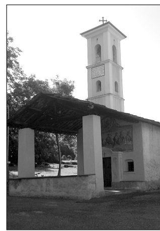
Festa di San Chiaffredo nella cappella di Bollano dall'8 al 10 agosto

Sabato 8 agosto Ore 21 spettacolo teatrale comico "Quasi per cluedo" con la compagnia