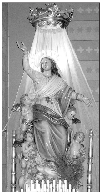
La statua dell'Assunta

Non ci resta quindi che ringraziare i massari per l'impegno che hanno messo a disposizione di tutti noi dedicando molto del loro