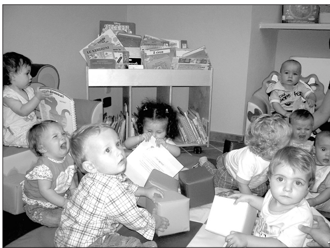
Nati per leggere: un libro a tutti i nati nel 2008

Innanzitutto il best-seller degli ultimi mesi: la trilogia Millennium - una descrizione della società contemporanea sotto forma di thriller - dello svedese Stieg Larsson. Se ancora non avete