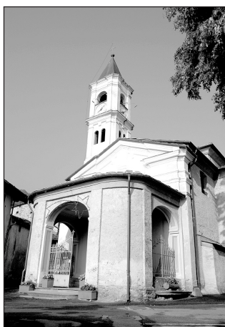
Festa patronale della Madonna della Neve a Robella ad inizio agosto

Ore 8 inizio 6° Meeting Fiat 500 bicilindriche e derivate organizzato dal gruppo "Le 500 della Valle Po" in collaborazione con il 500 Club Italia; Ore 16 processione accompagnata dalla banda folkloristica di Barge; Ore 17 rinfresco; ore 21 serata danzante con "I Primavera" di Bibiana. Ingresso gratuito. Durante i festeggiamenti sarà in funzione il servizio bar.