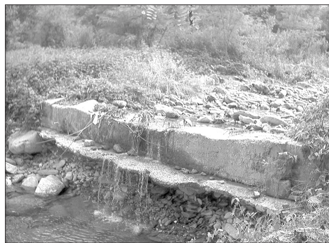
Sarà realizzato un guado sul Croesio verso Rocchetta

Procedono invece senza varianti i lavori relativi alla costruzione del campo da calcetto presso gli impianti