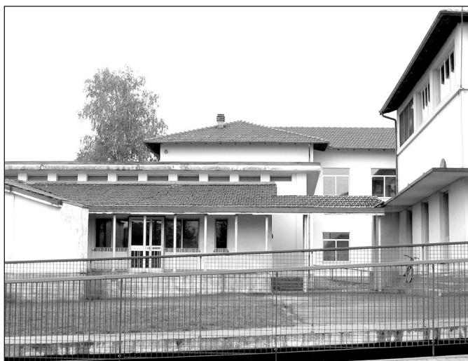
Il nuovo edificio sarà costruito con tecniche antisismiche

Tale cifra è congrua per ristrutturare l'edificio in questione, staccato dal plesso principale ma indispensabile per soddisfare le esigenze