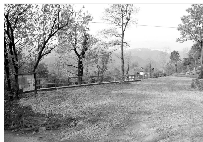
Come si presenta il parcheggio dopo i lavori

L'area dove sono stati realizzati i lavori è di proprietà comunale e costituisce una base di partenza per la "palestra di roccia", per l'ac-