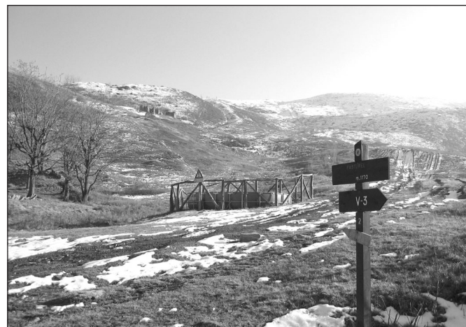
Da Pasturel si arriva a piedi (per ora) in Valle Varaita

Ma andando per ordine, si segnala, nel primo anno, il completamento dei lavori di sistemazione dell'alveo