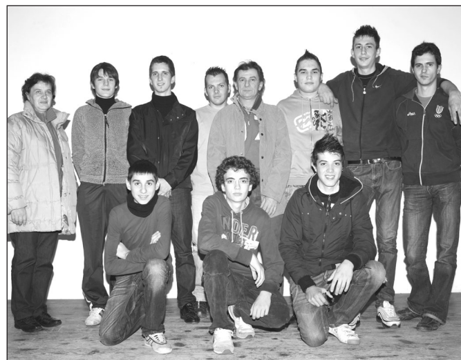
Ecco il nuovo direttivo della Pro Loco di Sanfront