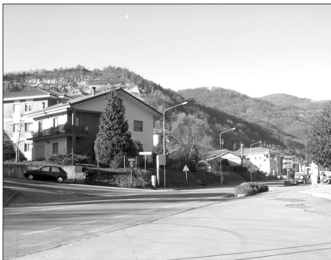
Sarà rifatta l'illuminazione in Via Valle Po e Via Gianotti

Tra le altre opere in corso o realizzate nell'attuale periodo vi è poi il restauro del portale ottocentesco , posto a confine tra la strada comunale ed il cortile interno del fabbricato polivalente conosciuto come "ex asilo" (già sede della Pretura) in Via Trieste, dove si rendevano necessarie ed urgenti alcune opere di recupero per preservare tale importante monumento storico appartenente alla comunità sanfrontese. L'intervento, costato 10.000 euro interamente finanziati dalla Fondazione Cassa di Risparmio di Saluzzo, è stato realizzato dalla ditta Demarchi geom. Efre & C. sas di Saluzzo in possesso dell'attestazione SOA - Cat. OG2 (restauro e manutenzione di beni immobili soggetti a tutela).