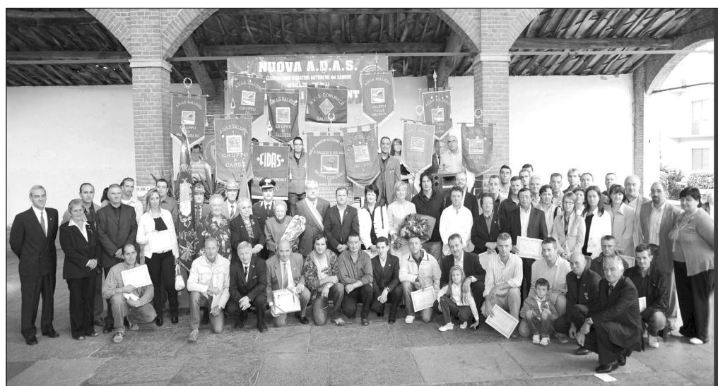
Il gruppo dei donatori di sangue Adas di Sanfront con le autorità presenti

Questi dati sono il segno della forza che si è creata all'interno del gruppo dove i vari elementi con attività di informazione o semplicemente attraverso "passa parola" cercando di sensibilizzare la popolazione per rendere il gruppo sempre più attivo e numeroso.