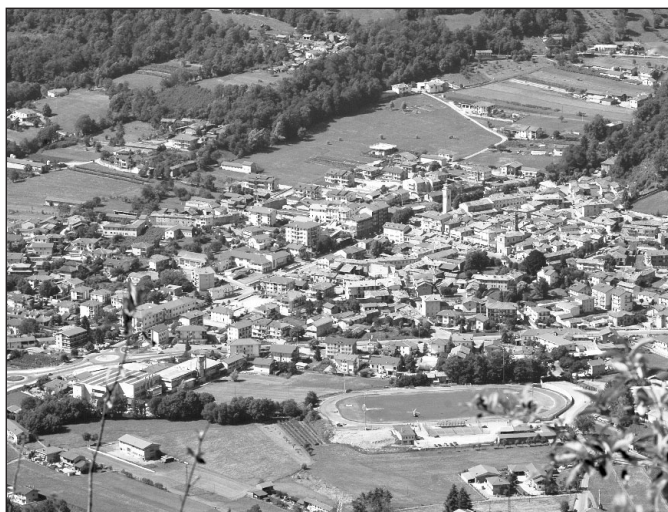
Il provvedimento vale per tutti gli immobili del paese

Saranno esclusi dalla definizione agevolata gli atti impositivi che, alla data di pubblicazione del Regolamento, siano divenuti definitivi per mancanza di impugnazione davanti alle Commissioni Tributarie nonché i carichi iscritti nei ruoli per la riscossione coattiva in base a titoli definitivi.