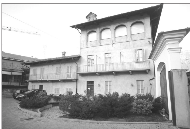
Sarà sistemato l'ultimo piano dell'ex Asilo

L'intenzione di completare le opere intraprese in più lotti nell'ambito considerato è scaturita dall'opportunità di accedere ad un cofinanziamento privato derivante da un istituto di credito che potrebbe dunque, se concesso, apportare i fondi necessari per ultimare il recupero dell'immobile. E' già stato individuato un professionista idoneo alla