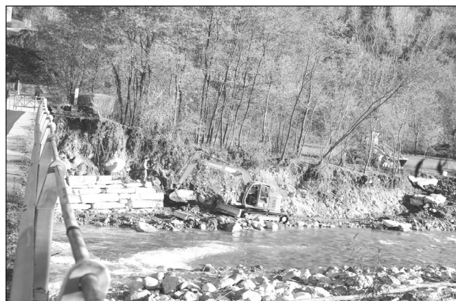
Gli interventi post-alluvione in V.Mombracco

Ed è così che, probabilmente entro fine anno, o nei primi mesi del 2012, andranno all'appalto i nuovi lotti di Sanfront e Rocchetta (100.000 euro), un tratto di