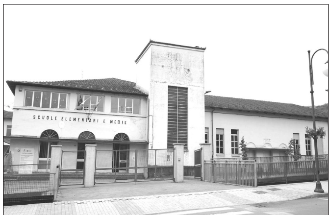
Sarà a Sanfront la sede della Dirigenza scolastica

Paesana accorpato a Sanfront Verso la conclusione i lavori di miglioria interni al Municipio