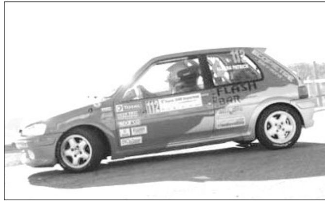
I risultati raggiunti ed i progetti futuri di Patrik Albera

Nonostante qualche piccola difficoltà nelle prime gare a cui ho partecipato, il se-