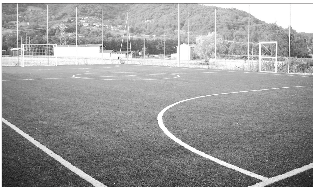
In programma nuovi lavori agli impianti sportivi. Nella foto il campo da calcetto

Il secondo anno non figurano opere in programma. Nel 2014, infine, è stata invece riproposta la rea-