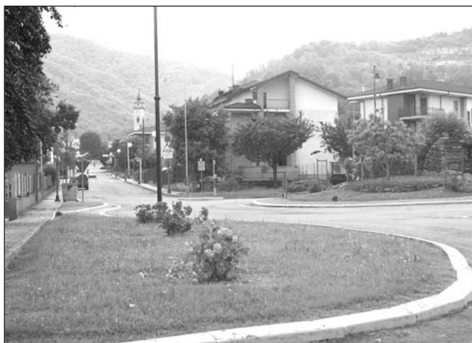
Interventi di migioria dell'arredo urbano in paese

Tra questi vi è la sistemazione interna del campo nuovo presso il cimitero del capoluogo per la quale la Regione Piemonte, Direzione Opere Pubbliche, aveva concesso, ai sensi della L.R. n° 18/84, un contributo complessivo di 25.000 euro. In questo caso avevamo già accennato in merito alla realizzazione di una scala monumentale per il collegamento tra la parte bassa ed alta del sito considerato. Per far fronte ad altre esigenze, tale scala è stata "ridimensionata" e nel medesimo progetto, redatto dall'Ufficio Tecnico Comunale, già ap-