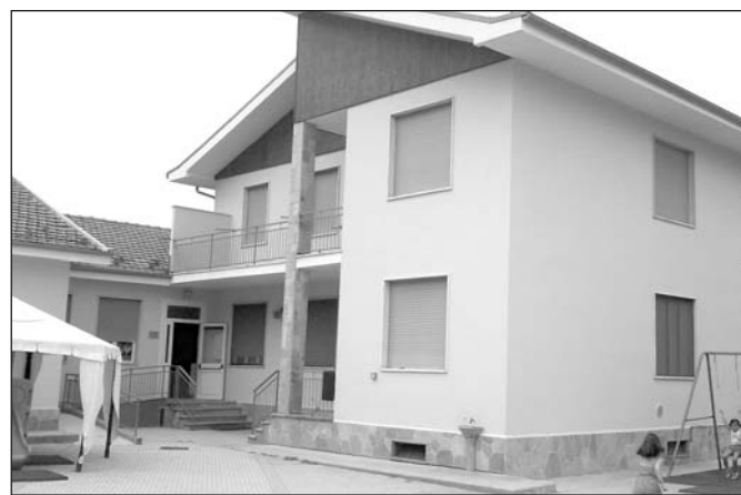
"Bimbo Estate" nel mese di luglio all'Asilo (Battisti)

Visto che ciò non è stato possibile, proprio per la mancanza di tale documento da parte di un'insegnante, in possesso comunque di diploma di scuola superiore, si è venuto a creare, all'interno della scuola stes-