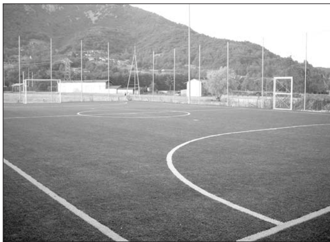
Il nuovo campo da calcetto recentemente ultimato

L'importo complessivo dei lavori, per i quali è stato concesso contributo in conto capitale della Regione Piemonte pari al 40% (il restante 60% finanziato mediante un mutuo agevolato con l'Istituto per il Credito Sportivo) ammontava ad euro 99.016,30. Dal resoconto finale dell'Ufficio Tecnico Comunale, che ha gestito