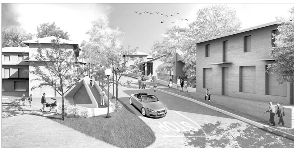
Ecco come si presenterà Via Paesana una volta ultimato l'intervento di sistemazione

L'aspetto che comunque darà più risalto all'intervento sarà rivolto alla sostituzione delle piante. Dopo