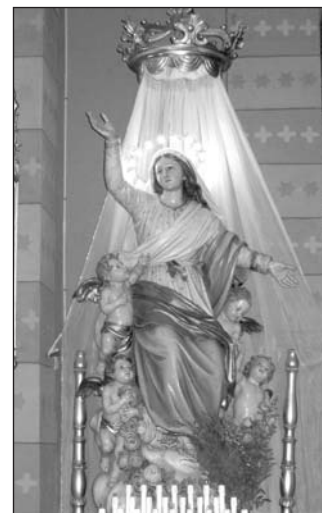
La statua della Vergine Assunta sarà portata in processione il 15 agosto