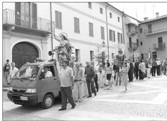
La processione dell'Assunta dello scorso anno

(segue da pag. 1) Festa San Bernardo di Comba Gambasca e Bedale domenica 22 agosto - Messa alle ore 15,30